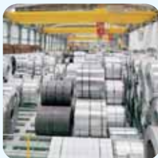
Posicionamiento de grúas