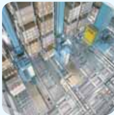
Técnica de almacenes